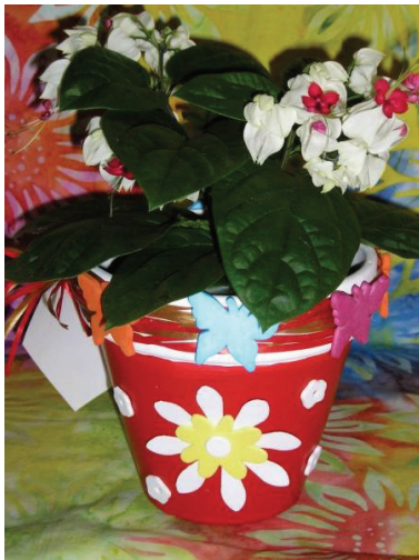
Pot de fleur décoré