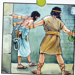
Vie de Paul 1 leçon 4

A lire Actes 16.13-32 Dieu veut que chacun puisse croire en Jésus et entrer dans sa famille.