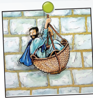
Vie de Paul 1 leçon 2