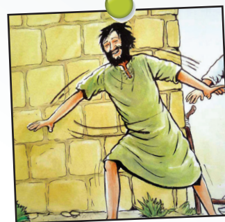
Vie de Paul 1 leçon 3

Pour partager l'Évangile, voici une méthode toute simple. Prenez le coin-coin aux 4 couleurs. Au dos du triangle jaune, écrivez "Dieu est parfait et il nous aime" ; au dos du noir, "Nos méchancetés nous séparent de Dieu" ; au dos du rouge, "Jésus a été puni pour nos fautes" ; au dos du blanc, "Crois en Jésus et reçois le pardon et la vie avec Dieu". Les enfants demanderont à leurs amis de choisir un chiffre. Ils ouvriront le coin-coin le nombre de fois demandé. Les amis sélectionneront une couleur et le message derrière cette couleur sera lu. Ils continueront ainsi jusqu'à ce que toutes les couleurs aient été sélectionnées.