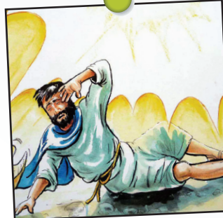
Vie de Paul 1 leçon 1

Prenez une mappe monde, puis cherchez le site de "Portes Ouvertes Eglises Persécutées". En sélectionnant "Index pays par pays" vous pourrez découvrir une liste d'endroits dans le monde où sévit la persécution. Tâchez ensemble de localiser quelques pays sur la carte. En cliquant, vous obtiendrez le profil et quelques informations qui vous permettront d'intercéder plus précisément pour la situation. En famille, choisissez un pays pour chaque jour de la semaine et priez pour nos frères et soeurs persécutés. (En lisant les articles à l'avance et en les résumant, vous éviterez de choquer les plus jeunes.)